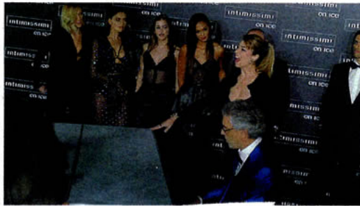
Mozzafiato Sopra, una delle top model sul red carpet, forse la più famosa: Irina Shayk. A fianco, Andrea Bocelli con le modelle canta prima dello show