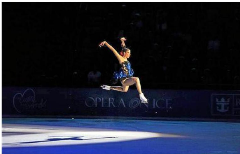
Carolina Kostner durante lo spettacolo Opera on Ice in Arena

L'Arena si tramuterà in lago al suono di cascate, per diventare poi ghiaccio e iceberg, illu-